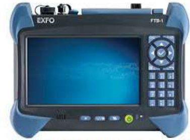
FTB-1スラットフォーム OTDRテストモジュール